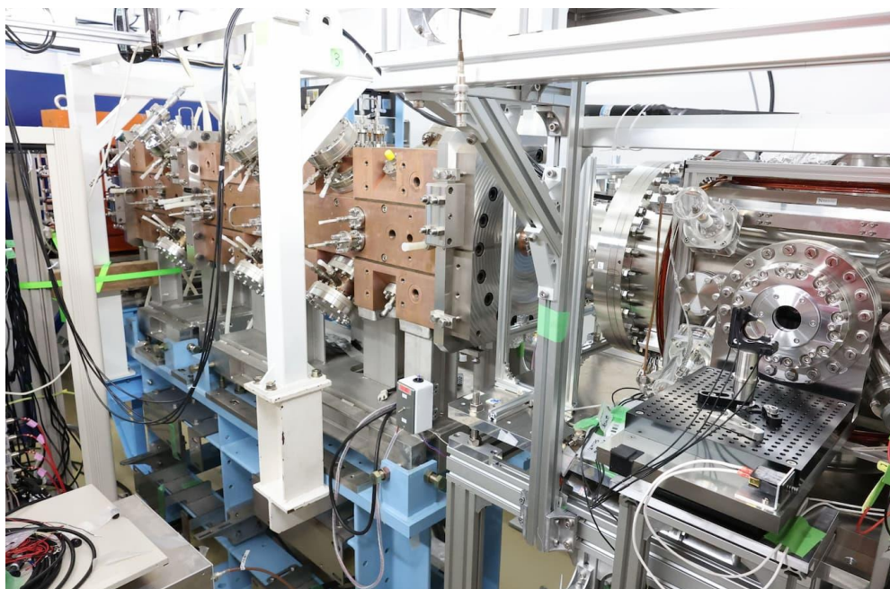
J-PARC で開発中のミュオン加速器

このような測定精度を達成することは容易ではありません。私たちは FNAL の実験を超える精度を目指して J-PARC で新しい実験の準備を進めています。新しい実験手法であるため実現は簡単ではありませんが、まずは世界初のミュオン加速器の実現にむけて一丸となって研究に取り組んでいます。