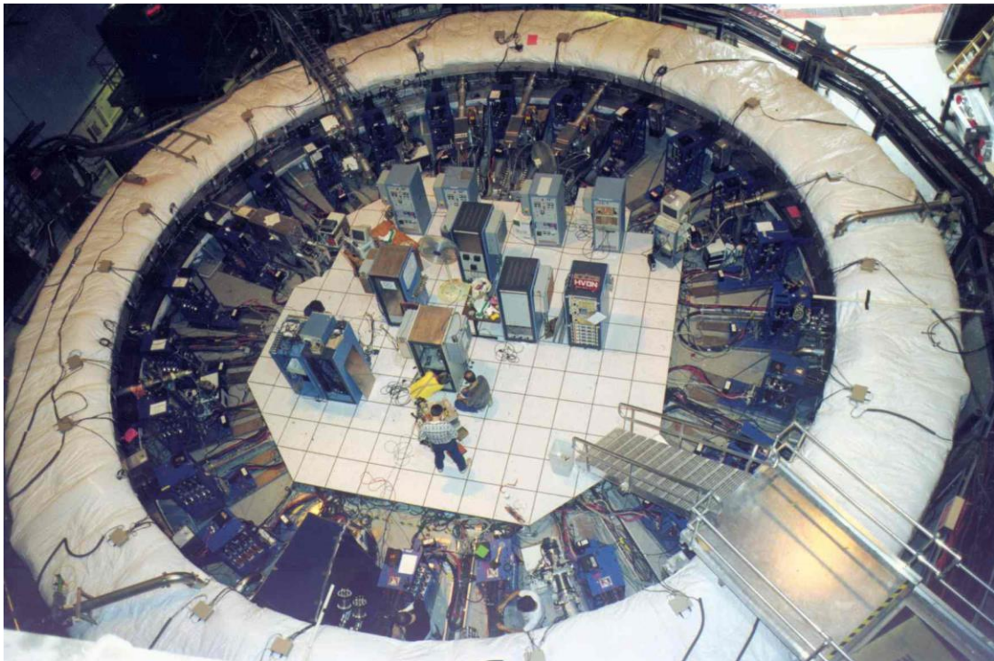
米ブルックヘブン国立研究所 (BNL) に設置されたミュオンの異常磁気能率測定用超伝導蓄積リング

米グーグルの創業者ら米国の IT 起業家らが出資するブレークスルー財団が主催する自然科学の国際的な学術賞「ブレークスルー賞」が 4 月 18 日 (日本時間 4 月 19 日) に発表されました。基礎物理学部門では、欧州合同原子核研究機関 (CERN)、米ブルックヘブン国立研究所 (BNL)、米フェルミ国立加速器研究所 (FNAL) で引き継がれてきた素粒子ミュオンの異常磁気能率 ( g-2 ) の精密測定の結果が選ばれました。これらの国際共同実験には KEK の研究者も加わっており、山本明博士ら 4 人の名誉教授が受賞者に含まれています。