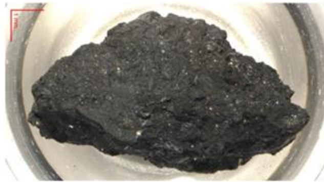
図1：今回分析した中で最も大きいリュウグウの石（C0002）の写真

研究グループは、世界最大強度のミュオンビームを利用できるJ-PARC MLFにおいて、ミュオンを用いた元素分析法をリュウグウの石（図1）に適用しました。この方法は、加速器で得られるミュオンを試料に打ち込み、出てくる ミュオン特性X線 ※2 を分析するものです。非破壊で元素を特定することができるため、貴重なリュウグウの石の分析において極めて有効な手段です。研究グループは、2008年にJ-PARCで初めてミュオンのビームが得られて（Miyake et al. Nuclear Instruments and Methods in Physics Research Section A , Volume 600, 22-24, 2009）以降、この分析法を隕石などの地球外物質に適用するための基礎研究を進めてきました（Terada et al. Scientific Reports , 4, 5072, 2014）。