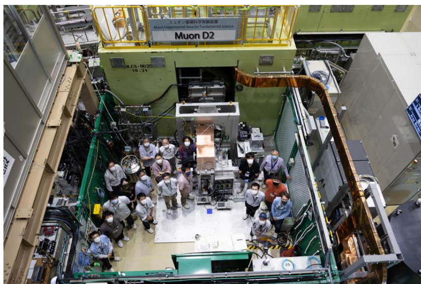
実験当日 J-PARC MLF ミュオン実験エリアに集まったミュオン分析チームメンバー