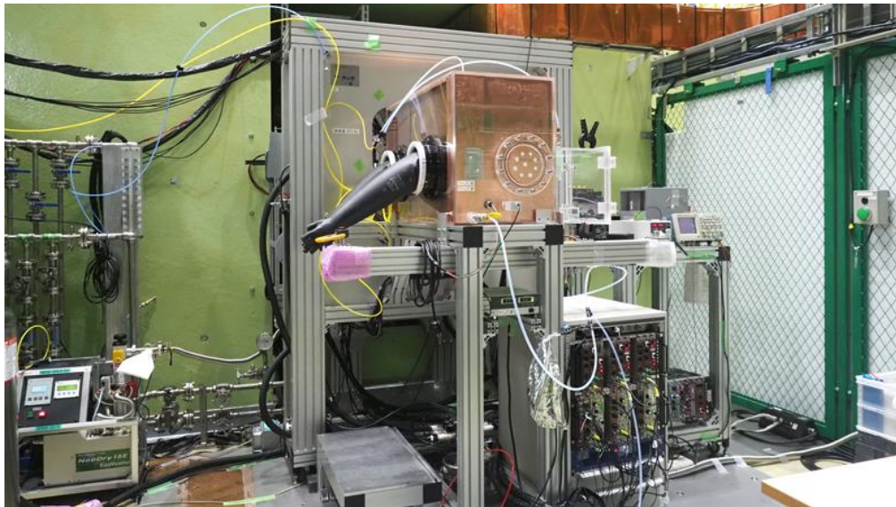
図 2： リュウグウの石を分析するために開発したミュオン元素分析装置 装置をヘリウムガスで満たすことで地球大気を完全に遮断できる。また内部を試料に 含まれていない銅で覆うことで、試料由来の微弱なシグナルを検出できる。

2021年6月に10個のリュウグウの石がJ-PARCに持ち込まれ、ミュオンによる元素分析が行われました。これにより図3に示すミュオン特性X線のスペクトルが取得されました。特に生命の材料物質である炭素・窒素・酸素について、リュウグウの石を損ねることなく検出することができたのは画期的な成果です。ミュオンの分析に利用されたリュウグウの石の重量はわずか0.1gあまりです。しかし初期分析における他の分析では、数mgもしくは \mu\text{g} オーダーの試料量で実験が行われており、このように大きなリュウグウの石を分析することができたのは、ミュオン元素分析法が非破壊の方法だからです。多くのリュウグウの石を使うことができたため、ミュオンによる