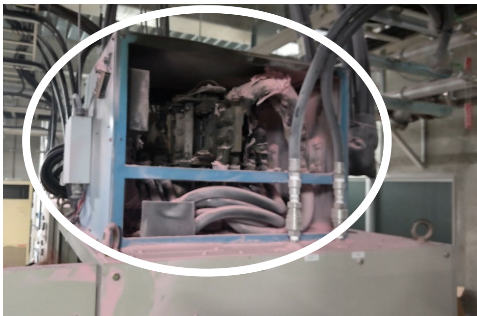
転極器右側面（内部の様子）